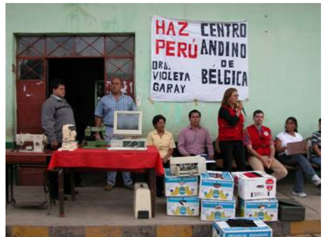
Aan het begin van elk nieuw schooljaar wordt extra schoolmateriaal verzonden. Wij blijven schriften, schrijfgerief, lessenaars en krijtborden verzamelen. Ook wordt soms geld overgemaakt om lokaal basisschoolmateriaal aan te kopen voor kinderen uit arme gezinnen.