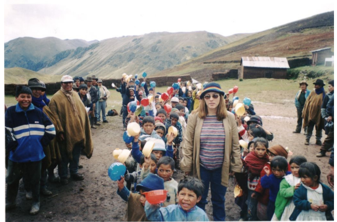
De goederen worden langs onberijdbare wegen tot in de afgelegen dorpen gedragen