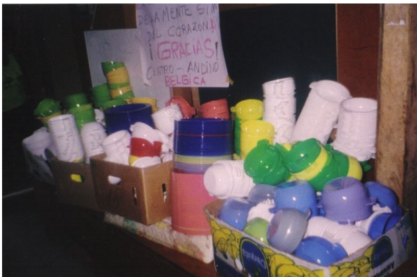
Plastic borden, tassen en kommen zijn erg geëerd in ziekenhuizen, buurtcentra en scholen.